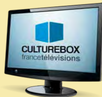
Télé : © Adobe Stock.

EXPOS, THÉÂTRE, CONCERTS... PENDANT L'ÉPIDÉMIE, TU PEUX T'ÉVADER SUR CULTUREBOX, LA NOUVELLE CHAÎNE DE TÉLÉ (CANAL 19).