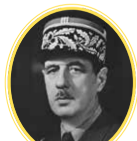
CHARLES DE GAULLE

Un résistant devenu président de la République en 1958.