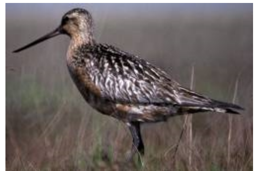
La barge rousse est capable de faire plus de 10 000 km en 8 jours sans toucher le sol.

Certains oiseaux sont capables de faire des milliers de kilomètres sans s'arrêter . Ils peuvent se nourrir en vol et même dormir en planant.